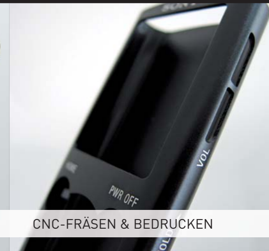
CNC-FRÄSEN & BEDRUCKEN

Am Ende ist es die Qualität, die zählt. – Dies vor Augen hat die COXON GROUP von Beginn an alles darauf ausgerichtet, den hohen Qualitätsansprüchen seiner Kunden gerecht zu werden. Heute, mehr als 20 Jahre nach Inbetriebnahme des ersten Werks in Taiwan, ist COXON eines der führenden asiatischen Unternehmen auf dem Gebiet der Kunststoffverarbeitung und Metall-Stanztechniken. Durch den Einsatz neuester Technologien kann die COXON GROUP umfassende Leistungen und Lösungen in den Bereichen Kunststoffverarbeitung, Metall-Stanzen, Veredelung und Montage anbieten.