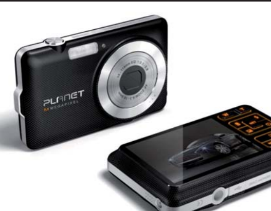
CONSUMER: SANYO PLANET