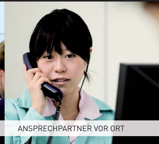
ANSPRECHPARTNER VOR ORT