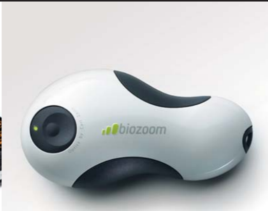
HEMOCARE: VODAFONE BIOZOOM