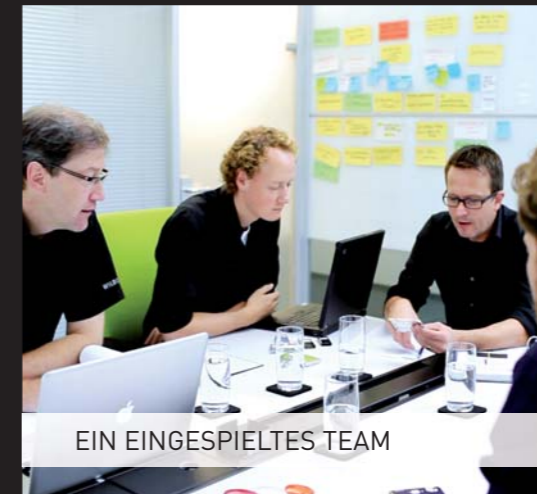
EIN EINGESPIELTES TEAM