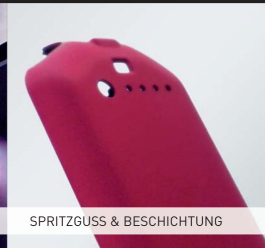
SPRITZGUSS & BESCHICHTUNG