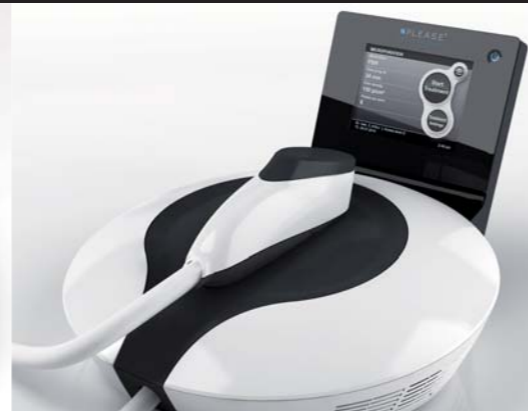
MEDICAL: PANTEC BIOSOLUTIONS