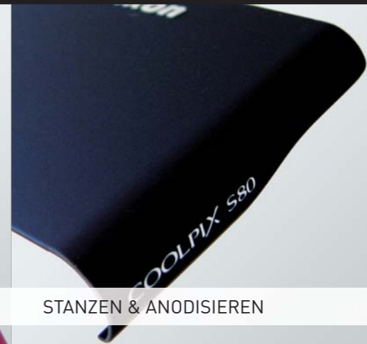
STANZEN & ANODISIEREN